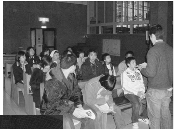
↑ 玉造教会で、教会の説明と高山右近の信仰を学ぶ中高生たち。