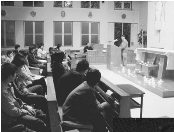
↑ お世話になった今市教会の方々と一緒にテゼの祈りをしました。

これを機会に、もっと中高生会がいろんな活動ができる場に来出来るように頑張っていきたいと思っます。